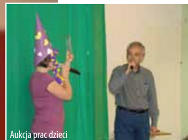
Aukcja prac dzieci