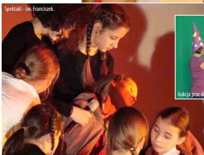
Spektakl - św. Franciszek.