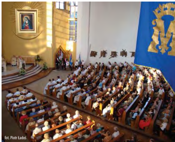
fol. Piotr Łados